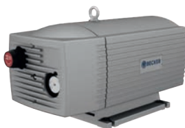
Vacuum: VT and VX