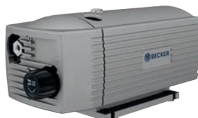
Pressure: DT and DX