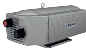
Combined: T and X